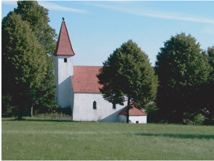
Niederärndt - älteste romanische Kirche in unserem Landkreis.